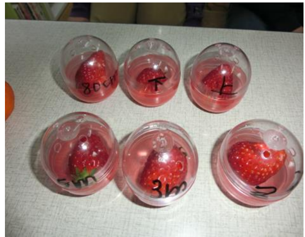
ガチャの入れ物を利用しました。

次亜塩素酸噴霧器は、イチゴを腐敗からどの程度守るか!? ミカンの実験と同じ場所六か所にガチャのカプセルに入ったイチゴを置きました。